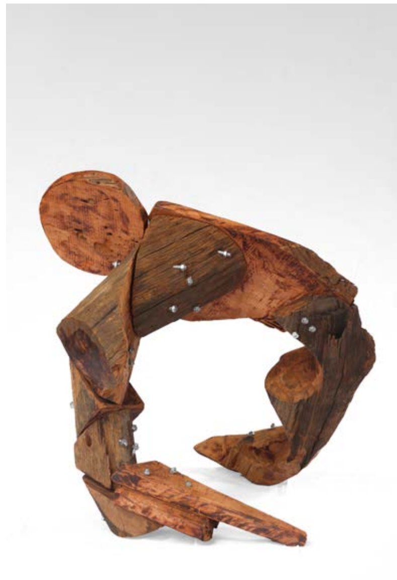
Lirhandzu Chanfuta, sândalo e parafusos sextavados 78 x 56 x 70 cm 2024