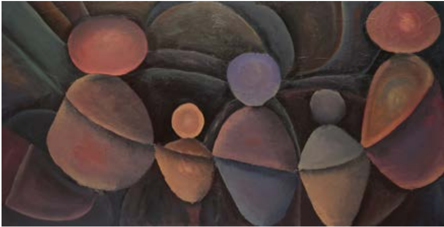
Paisagem de subsolo