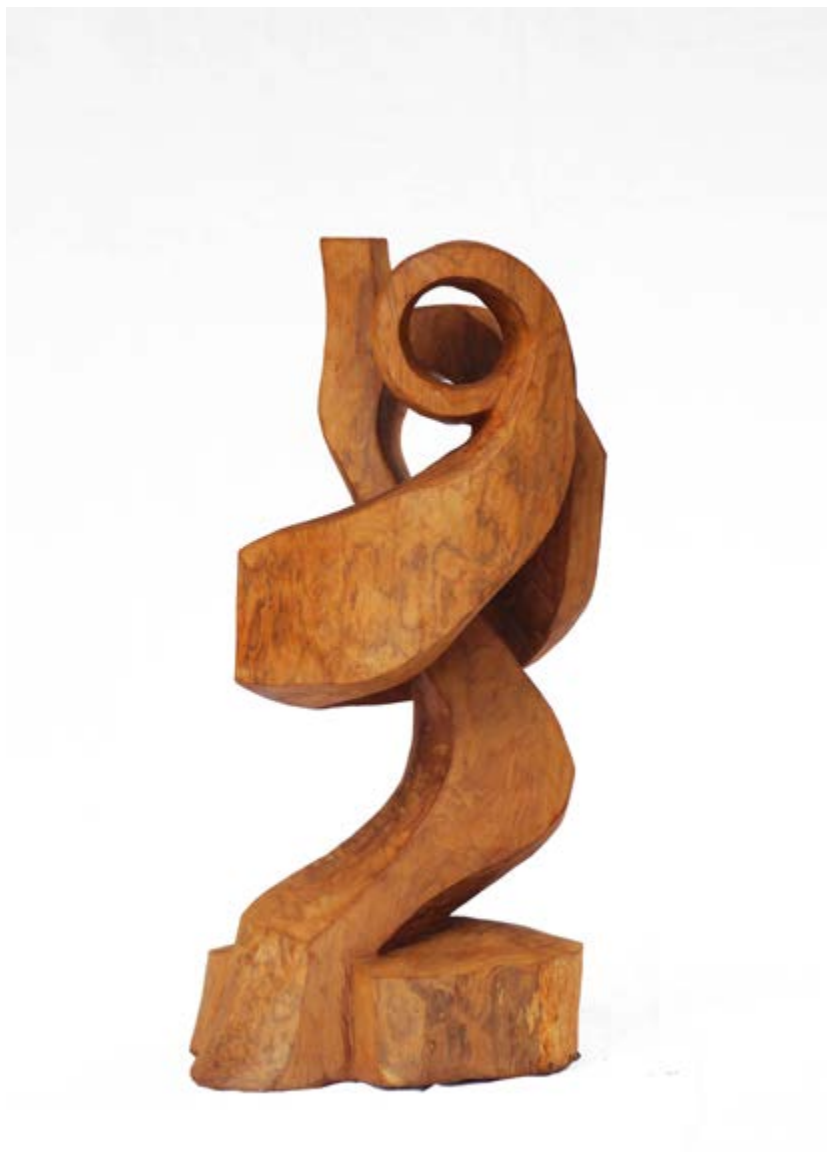
S/t Sândalo 36x25x62 2024