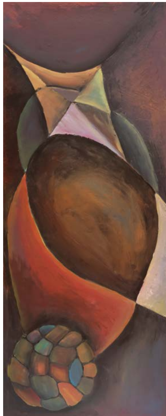
S/t Acrílico s/ tela 71 x 169 cm 2024