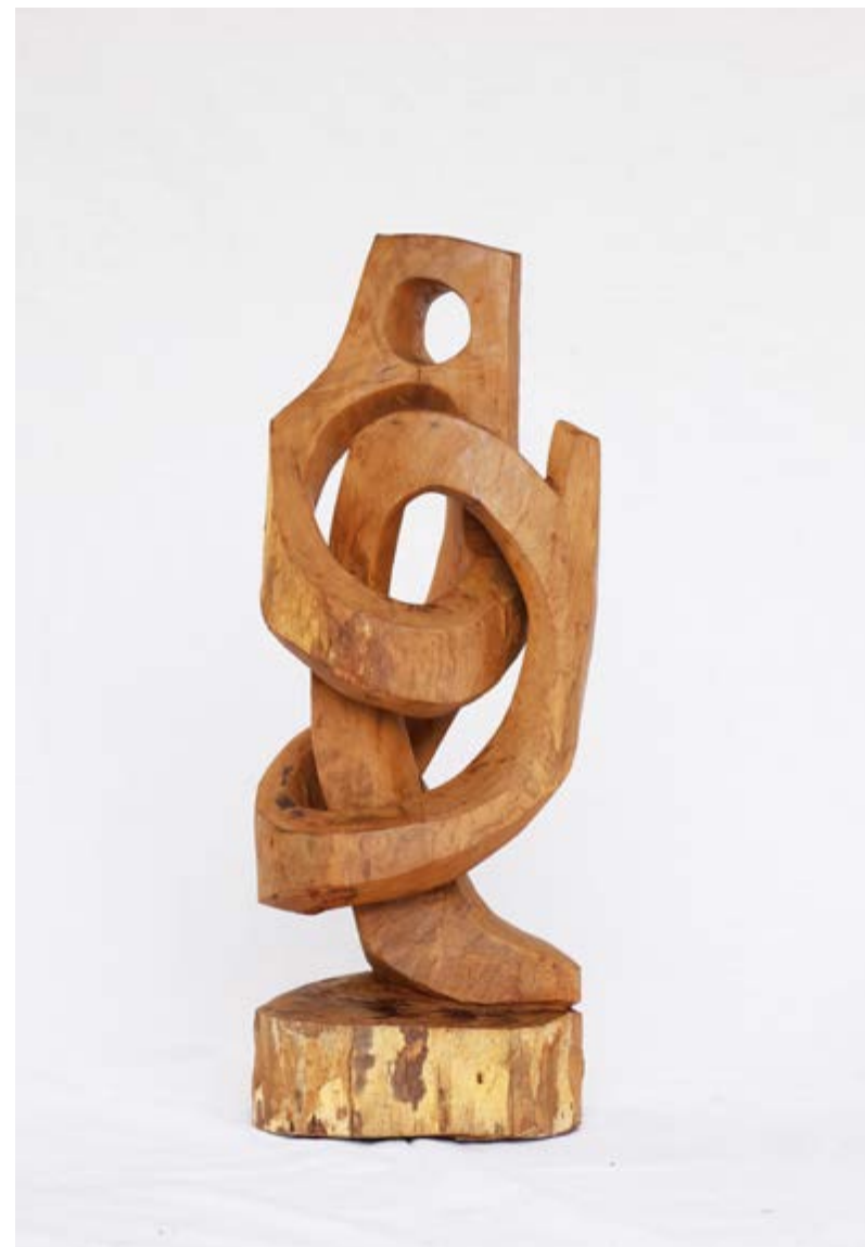
Entrelaçados Sândalo 25 x 21 x 66 cm 2024